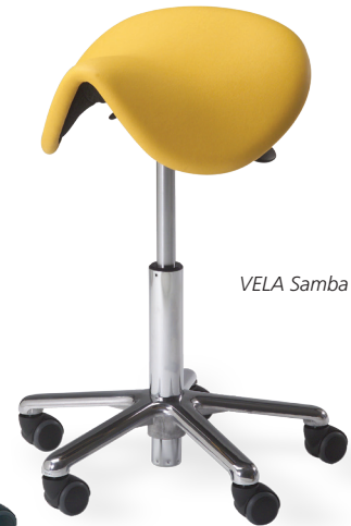
VELA Samba 400

Der VELA Samba hat einen ergonomischen Sitz und ein sehr kleines und kompaktes Untergestell. Ein weiteres charakteristisches Merkmal des VELA Samba ist die Möglichkeit, eine niedrige Arbeitshöhe einzustellen.