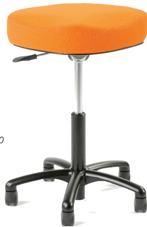
VELA Samba 410 by Hemmert design