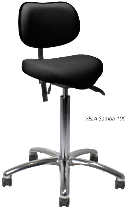
VELA Samba 100