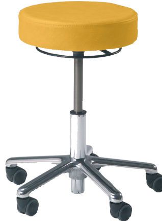
VELA Samba 500